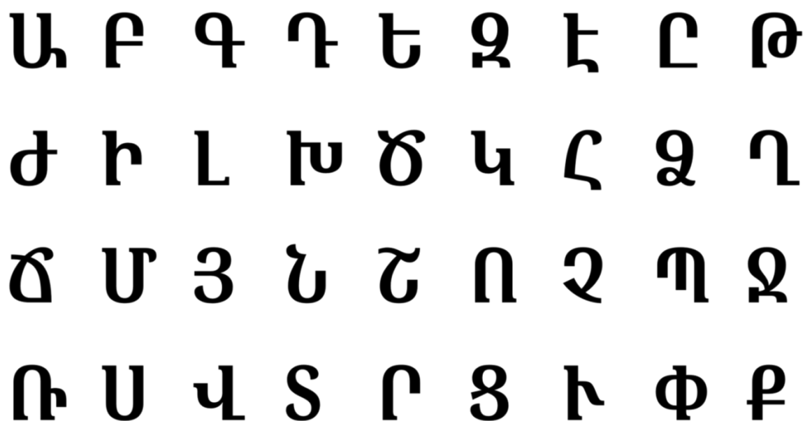
Рисунок 1 – Элементы армянского алфавита

зафиксировать координату нахождения символа с точностью до 10 метров (от её центра). Вычисления необходимо производить на борту. Сразу после приземления потребуется отдать представителям Оргкомитета карту MicroSD с файловой системой FAT32 и файлом objects-coordinates.csv, в котором данные об обнаруженных объектах записаны построчно в формате: <идентификатор объекта> (номер буквы начиная с 0 согласно приложенной картинке), <широта*1e7>, <долгота*1e7> широта и долгота в системе WGS84. Нумерация идёт слева направо, сверху вниз.